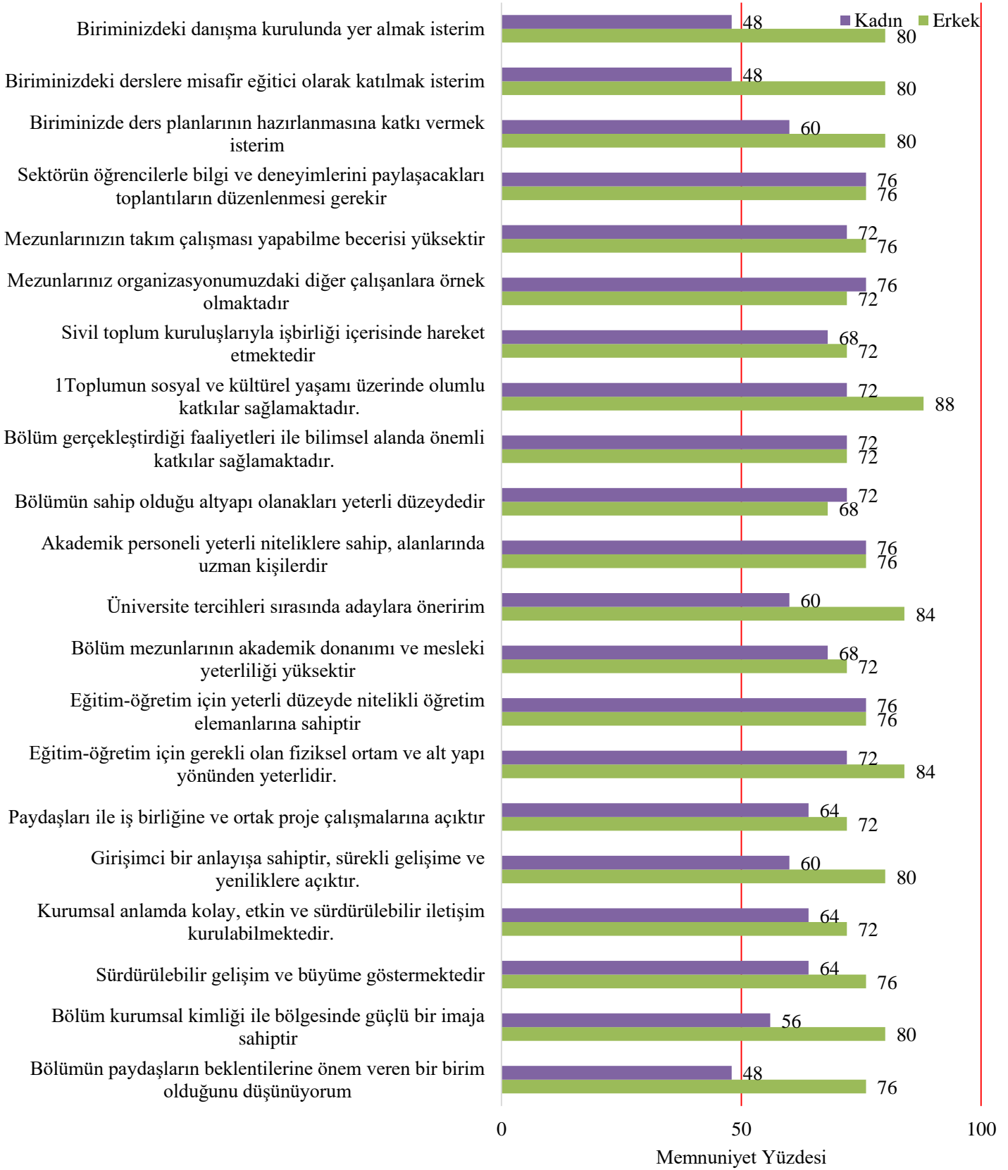
Grafik 2. Cinsiyet Ölçeğinde Memnuniyet Düzeyleri

Yapılan deęerlendirmede, erkek katılımcıların memnuniyet düzeylerinin genel itibariyle kadın katılımcılara kıyasla daha yüksek düzeyde olduęu tespit edilmiştir (Grafik 2)